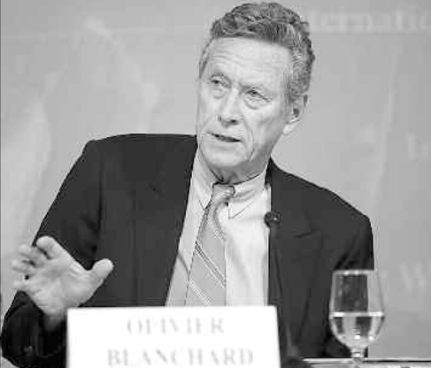
Ο επικρατέστερος οικονομολόγος του ΔΝΤ Ολιβιέρ Μπαλνσάρ λέει ότι ο δημοσιονομικός πολλαπλασιαστής που χρησιμοποιούν οι οικονομολόγοι του ΔΝΤ στους υπολογισμούς τους για την Ελλάδα δεν είχε εκτιμηθεί σωστά

Τώρα που ο σχετικός κατάλογος χωροληκτικές του ΔΝΤ, ο ΔΝΤ φέρθηκε για άλλη μια φορά (η πρώτη η ομολογία έγινε τον Οκτώβριο του 2012) ότι έφαλε σφαιρικό στις εκτιμήσεις του σχετικά με τις επιπτώσεις της λιτότητας στην Ελλάδα. Ο επικρατέστερος οικονομολόγος του ΔΝΤ Ολιβιέρ Μπαλνσάρ μας λέει ότι ο δημοσιονομικός πολλαπλασιαστής που χρησιμοποιούν οι οικονομολόγοι του ΔΝΤ στους υπολογισμούς τους για την Ελλάδα δεν είχε