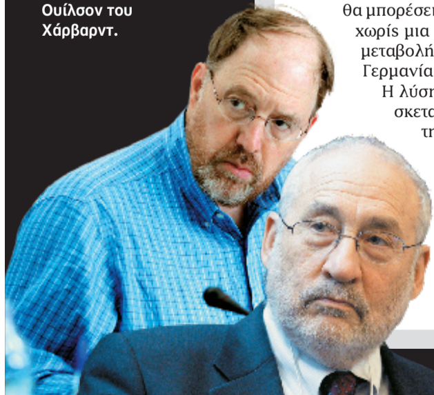
Ο Τζόζεφ Στίγκλιτς συμμετέχει στο διοικητικό συμβούλιο, ενώ ο Τζέιμς Γκάλιμπριθ συνεργάζεται με το Ινστιτούτο Levy Economics.

Το Ινστιτούτο Levy Economics Institute του Κολεγίου Bard ιδρύθηκε το 1986 ως ανεξάρτητος οργανισμός που ασχολείται πρωτίστως με θέματα οικονομικής πολιτικής. Η έρευνα των διακεκριμένων επιστημόνων που συνεργάζονται με το Ινστιτούτο επικεντρώνεται στην κατανομή του πλούτου, την ισότητα των φύλων, τη νομισματική πολιτική και τις αγορές. Στο διοικητικό συμβούλιο συμμετέχουν τρανακτά ονόματα, όπως ο Λέον Μπότσαϊν, ο Τζόζεφ Στίγκλιτς, ο Μάρτιν Λάιμποβιτς της Morgan Stanley και ο Ουίλιαμ Ουίλσον του Χάρβαρντ.